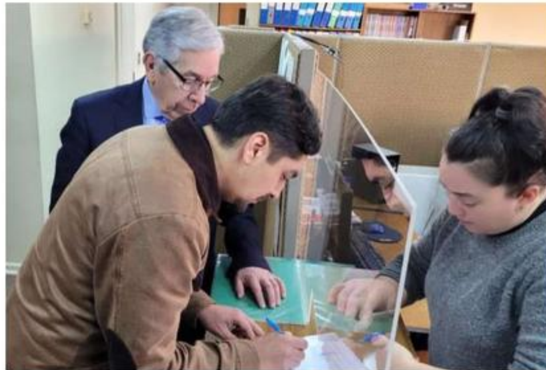
EL TRÁMITE EN EL TRIBUNAL ELECTORAL REGIONAL.